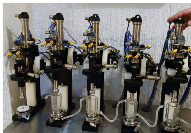
Utrustning för tuggprovning av Nicorette.