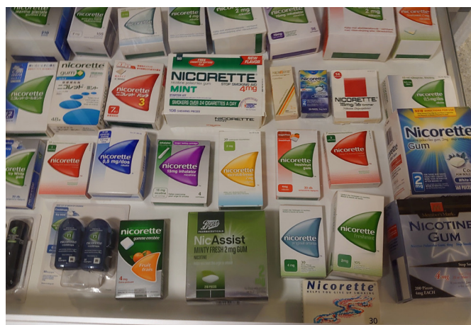
Exempel på Nicorette förpackningar.