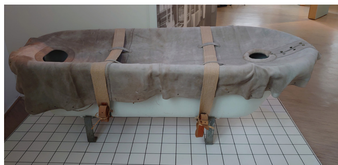
Oroliga patienter kunde ordinerar kroppstempererade bad ett par timmar dagligen i ett par veckor.