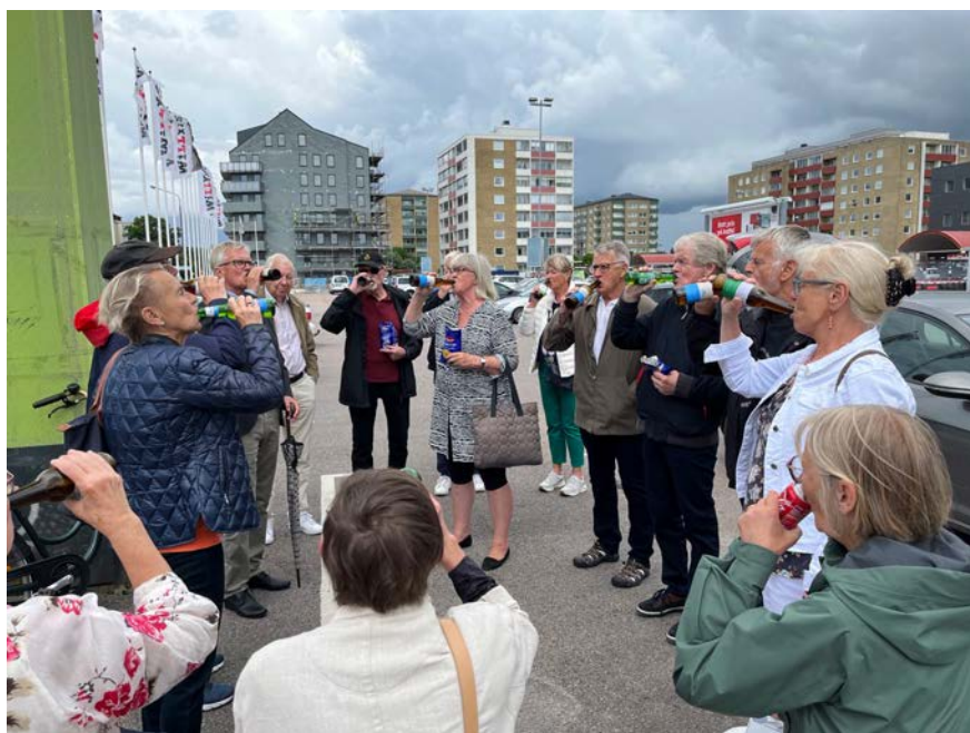
Höjdpunkten i gravölsceremonin