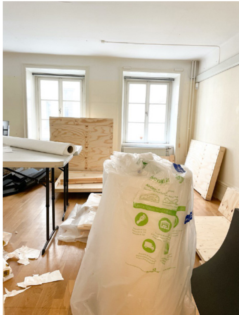
MTAB:s sista packdag.

All packning har genomförts på ett sätt som avser förenkla när de nya basutställningarna ska komma på plats. Kameran har varit användbar här. Foton på många av föremålen har jag lagt upp på museets webbplats. Den har också en "baksida" som inte är publik och som utgör vårt samlingsförvaltningssystem. Där gör vi noteringar som vi har nytta av när de nya utställningarna planeras. Andra föremål har jag ställt i grupper efter ämne och