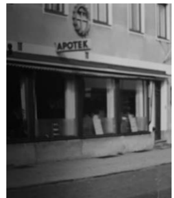
Apoteket i Grönskåra

Snart blev det aktuellt att bemanna det lilla filialapoteket i byn Grönskåra. Dit fick man inga sökanden så bemanningen fick bli en paragrafare som föreståndare och den apotekstekniker som behövdes skickades från apoteket i Mönsterås. Tre olika unga flickor kom en vecka var och jobbade.