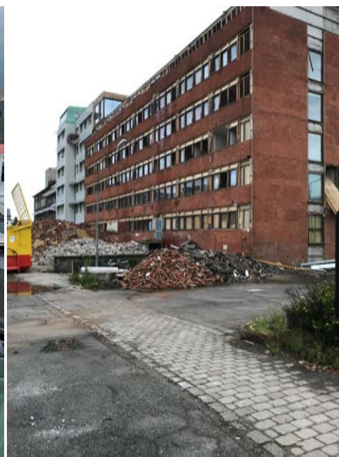
Ferrosans kontorshus, byggt 1972, i graven 2022.