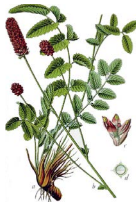
Figur 2. Blodtopp/Falsk Pimpinell ( Sanguisorba officinalis [major] ). Wikipedia/Storm.

S. minor beskrivs i Nordisk familjebok (2) på följande sätt: " S. minor ( Poterium Sanguisorba ) är polygam [dvs. har både en och tvåkönade blommor] och mindre än föregående, har