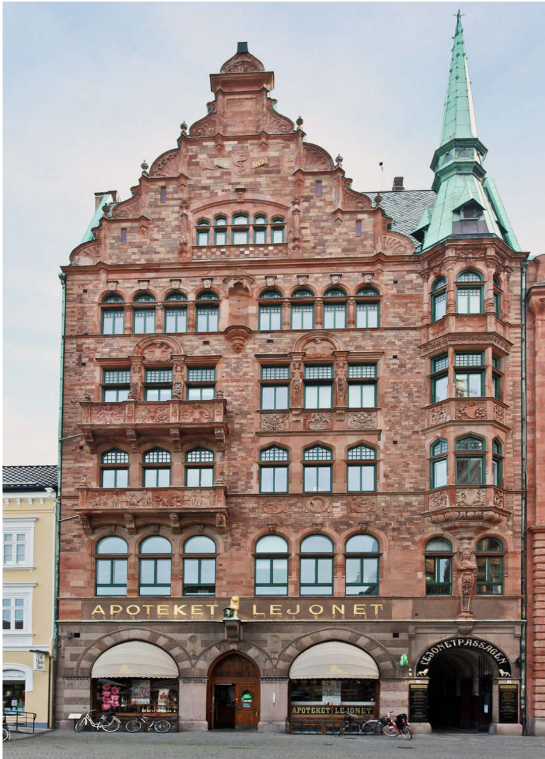
Apoteket Lejonet i Malmö