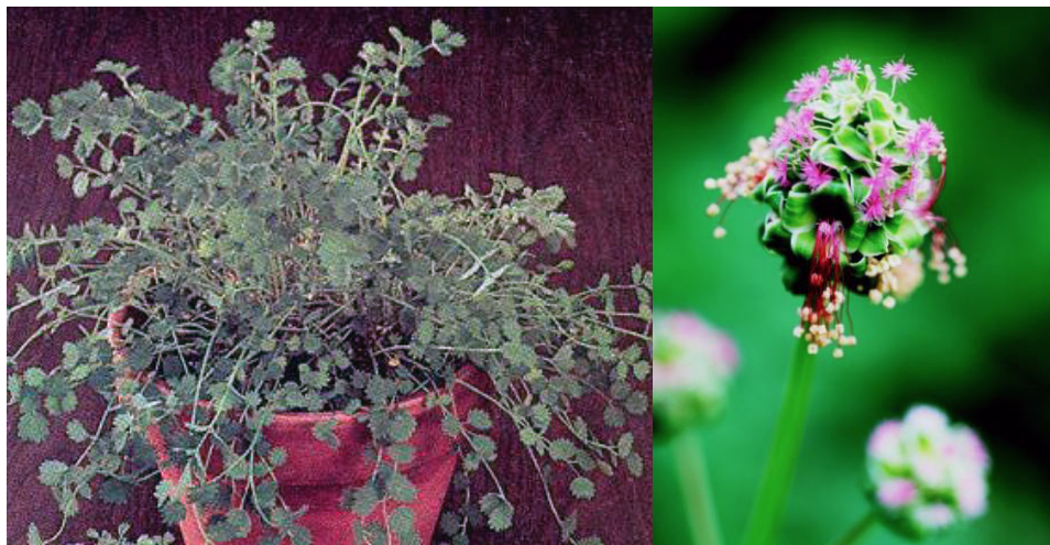
Fig. 5. (Äkta) Pimpinell ( Sanguisorba minor , Scop.; Poterium sanguisorba L.). Bilden t.v. visar en kruka med det bladverk som erbjöds till provning tillsammans med rött vin. T.h. visas ett blommande exemplar av Äkta Pimpinell efter utplantering.

kvistar o. blad av växten, använda ss. krydda m.m. i vin (jfr HOGLANDSVIN);".