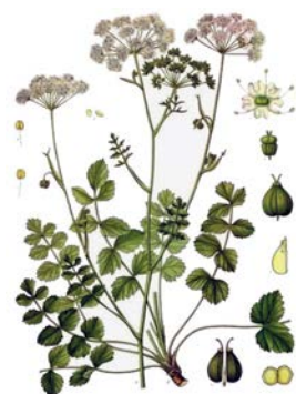
Figur 1. Bockrot, Pimpinella saxifraga . Wikipedia/Köhlers Medizinale-Pflanzen.