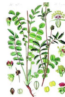
Figur 3. Äkta Pimpinell ( Sanguisorba minor ). Wikipedia/O. W. Thomé (1885).