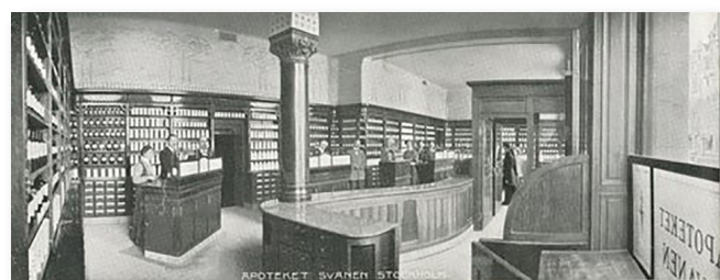
Apoteket Svanens interiör tidigt 1900-tal.

Apoteket fick emellertid behålla sin vackra jugend-