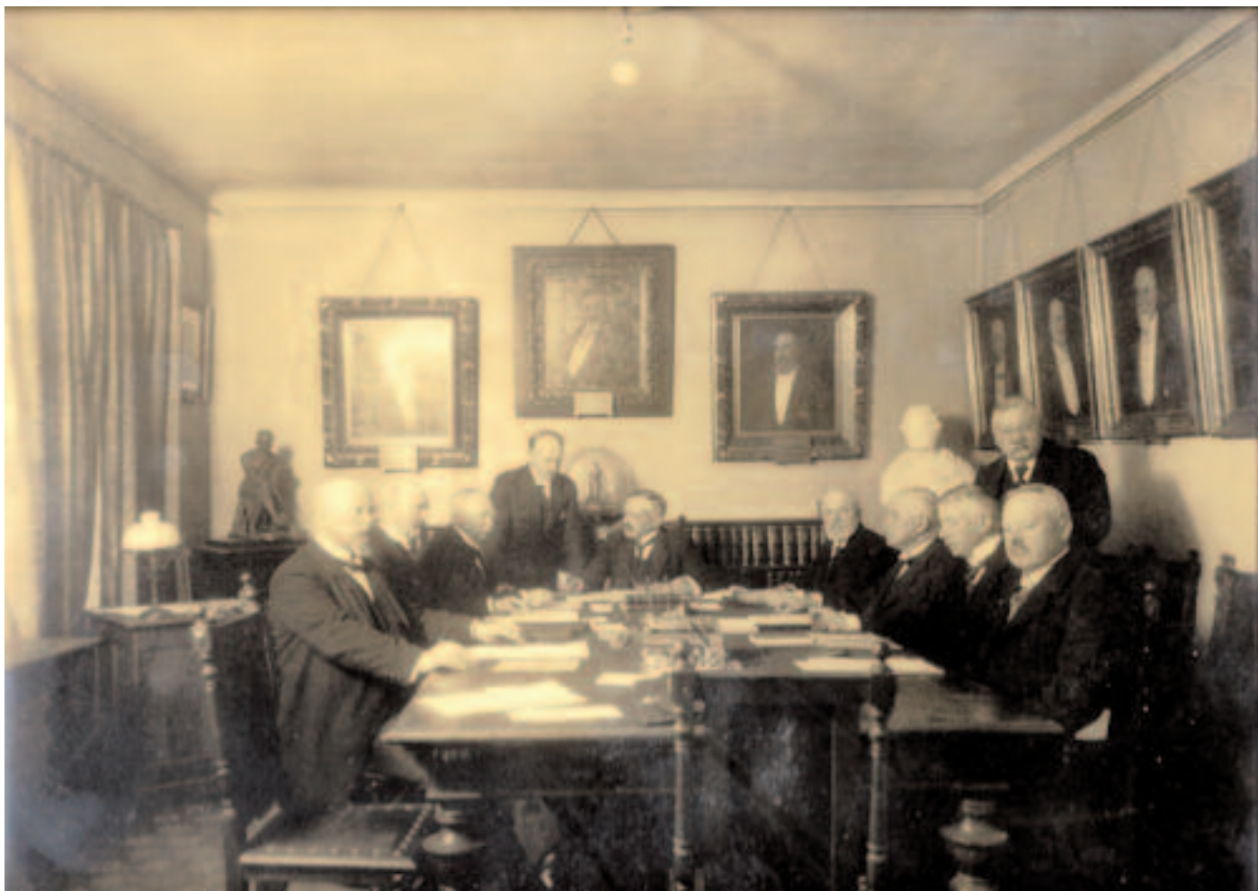
Direktionens sista sammanträde innan rivningen påbörjas på Wallingatan (1923)

Karlstad var han sekreterare och kassaförvaltare i Apotekarförbundets Värmlands-Dalakrets. Som innehavare blev han ordförande i Apotekarsocieteten 1923-1935. Han var även ledamot i Farmaceutiska Institutets styrelse 1920-23 och 1926-35.