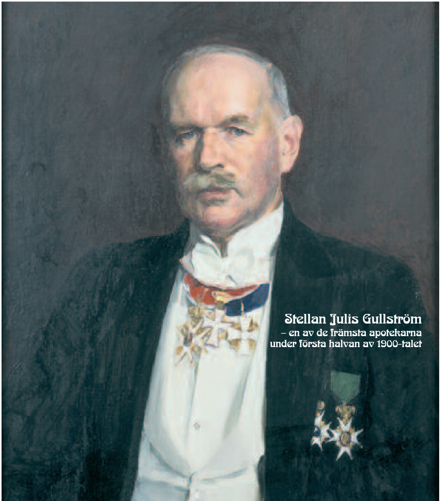
Stellan Julius Gullström – en av de främsta apotekarna under första halvan av 1900-talet