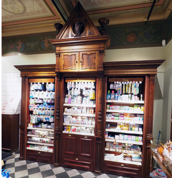
Hyllfack anpassat till nuvarande sortiment i självväl.

Taket är indelat av balkar med rikt utformade taklister med blad och blommor i de mindre fälten. Färgerna är milt rosa, ockra och klargult. Taket bärs av två brunmålade stål-kolonner med gråmålade, delvis förgyllda kapital. Längs taket finns en bred målad bård med kraftigt utformade blad och blomsterrankor och putti i grönt, rött och blått mot mörkgrön botten. Fönstersmygarna är i helfransk smygpanel målad i jakarandaimitation. De tidigare armaturerna som bestod av opalfärgade skålar, efter förebild från Strindbergsmuseet, som belyste takmålningarna har dock ersatts med spotlights.