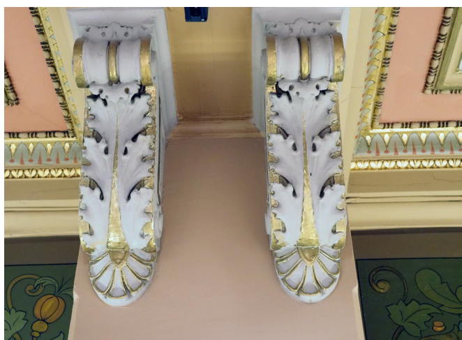
Stuckatur mot taket