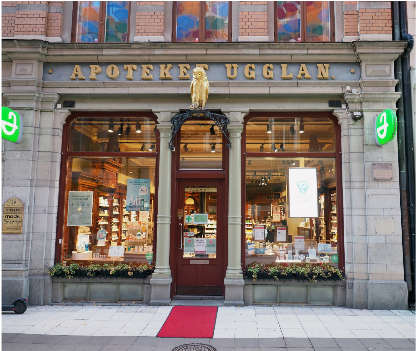
Apoteket Ugglan Stockholm