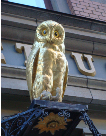
Den förgyllda Ugglan.

(men försiktigt restaurerad). Byggnadens fasad är i rött tegel med lister och fönsteromfattningar av ljus sandsten. Apoteksfasaden har två stora skyltfönster och i mitten en modern glasad entrédörr, som flankeras av två gråmålade kolonner av järn (se bild i inledningen). Ovanför dörren finns en förgylld uggla på ett underrede av smidesjärn.