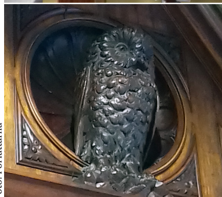
De nuvarande receptavdelningen ligger längst in i officinen.