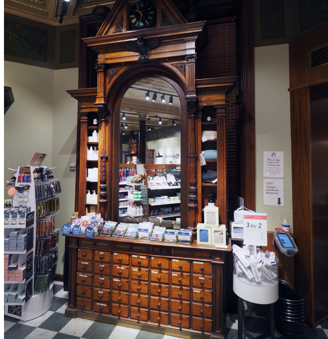
Klockskåpet med nuvarande placering.

I 1893 års inredning fanns ett låd- och hyllparti med klocka placerat längst in i officinen. När officinytan 2010 behövde utvidgas för att ge större utrymme för receptfria läkemedel och andra varor öppnades fondväggen mot de bakre lokalerna. Klockskåpet placerades då till vänster mot den södra väggen. Där bakom finns nu utrymme för receptexpedition. I stället för de tidigare hyllfacket försågs klockskåpet redan före ombyggnaden 1993 med en spegel. Skåpet är numera endast dekorativt.