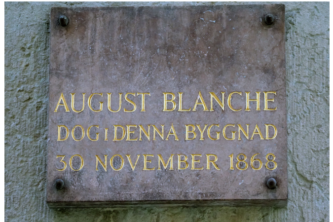
Skylt på fastigheten Apoteket Ugglan