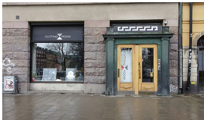
Numera finns bara portomfattningen med sina pilastrar i kopparplåt kvar exteriört.