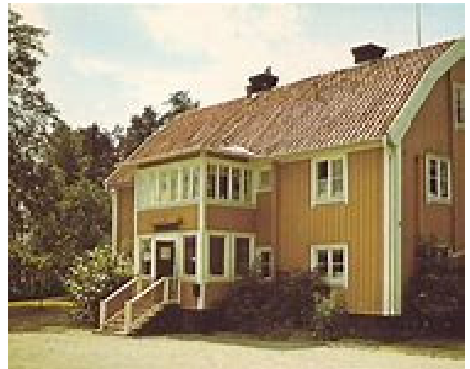
Hammarby apotek