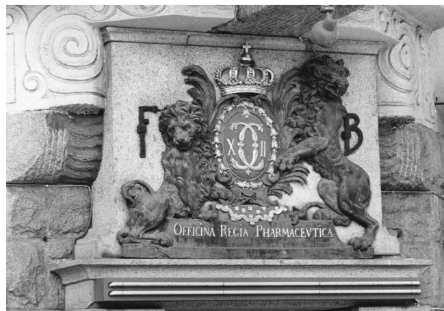
Emblemet över entrén som numera finns på Farmacihistoriska museet.