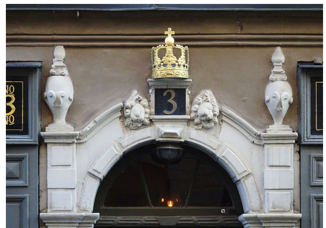
Apoteket Kronan från Storkyrkobrinken.