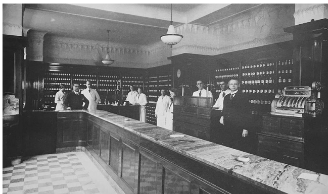
Officinen ca 1930.