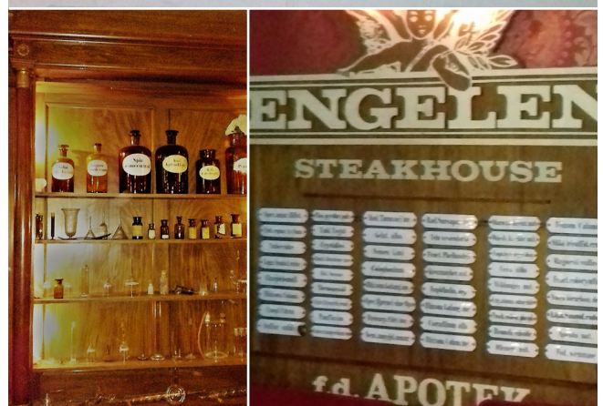
Engelen, nuvarande entrén samt drogkärl, låds kyltar, skåp.

gästas Engelen istället av Sveriges främsta coverband och flera dagar i veckan bjuds det på en härlig stämning med konceptet Rockbar". Vi lägger till att källarvalv med anor från 1600-talet och några rum för finare måltider finns också.