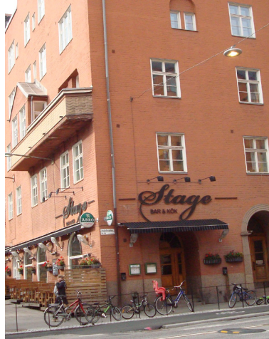
Nuvarande fasad och entré.

lande vyn av Tvättfa- tet som beskrevs som en stinkande dypöl fyllt och omgiven av allsköns bråte.” Den numera vackra par- ken heter officiellt idag Bäckmans park!