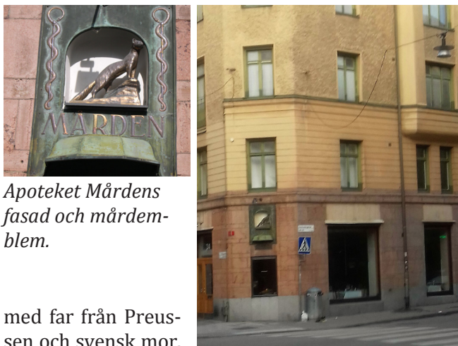
Apoteket Mården fasad och mårde-blem.

med far från Preussen och svensk mor. Han var starkt engagerad i apotekarkårens verksamhet. Han överlämnade 1925, då han tillhört apotekarkåren under 50 år, en gåva på 10 kkr (omräknat 270 kkr år 2010) och senare 25 kkr (omräknat 670 kkr år 2010) att utgöra två fonder att användas för understöd till behövande änkor och barn till kollegor.