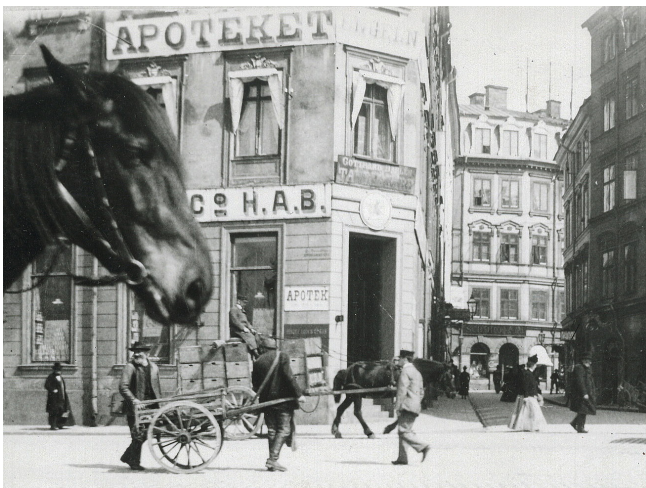
Apoteket Engelen, fasad cirka 1900.

Grundades 1649. Det var det i åldersordning tredje apoteket i Stockholm och det första som i Sverige anlades av en infödd svensk. Det låg först vid Järntorget i Gamla stan. Flyttades till Adlerschöldska huset (senare Plomgrenska) Kornhamnstorg 2 och år 1878 till en grannlokal. Till den nuvarande adressen flyttade apoteket 1910 (Kornhamnstorg 59 B).