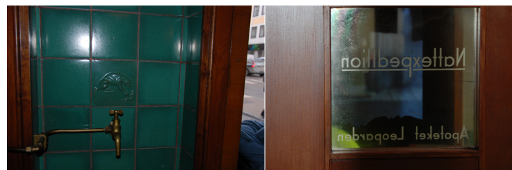
Dricksfontän och nattvaktsslucka.

** RVO och RNO står för Riddare av Vasaorden respektive Riddare av Nordstjerneorden och var förtjänstmedaljer som utdelades till och med 1974.