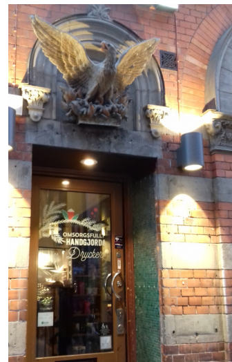
Apoteket Fenix, entré.