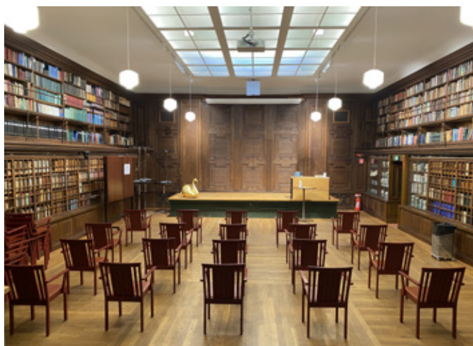
Apotekarsocietetens bibliotek förr och nu.